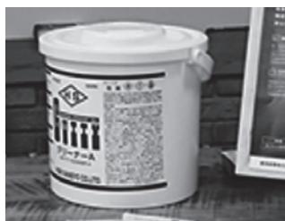
ガッティークリーナーA

クリーナーAの洗浄液の特徴は、洗浄成分、指紋除去成分を配合。さらに防錆潤滑成分を配合している。潤滑成分で滑りを良くすることで作業性の向上が図れるほか、一般的な測定機器洗浄に用いられる無水アルコール(エタノール)と違い、防錆成分を配合することで拭いた直後の錆の発生を防止する。