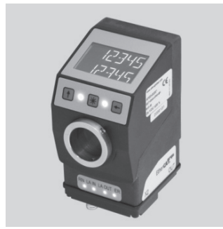
手動による段取り替えをナビゲートするインジケータ

「アシストインジケータ(イーサネット対応タイプ)」は、手動による安心・確実な段取り替えをナビゲートするインジケータ。