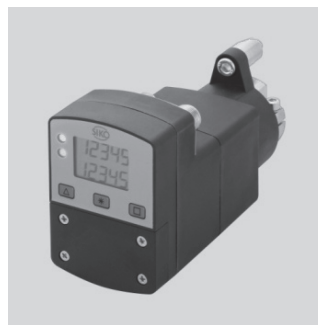
全自動位置決め用 アクチュエータ

「アシストアクチュエータ」は、全自動位置決め用ネットワーク対応コンパクトアクチュエータ。取り付けしやすい省スペース設計で、内蔵のモーター駆動による自動段取り替えが可能。大規模な段取り替えがある場合に最適である。