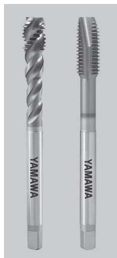
キャンペーン対象製品(左) VUSP / (右) VUPO