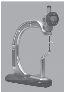
アルミ素材の削り出しで造り込んだ板厚確認器「アツヨシ」

ている方へ」--板厚確認の新スタンダード「アツヨシ」が開発・発売され注目を集めている。 カナエ工業(本社=静岡県富士宮市)の発売した板厚確認器「アツヨシ」は、現場のニーズに応えた驚きの特長。